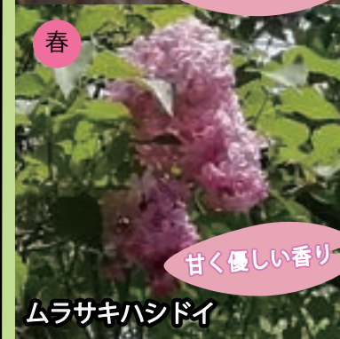
春 ムラサキハシドイ 甘く優しい香り