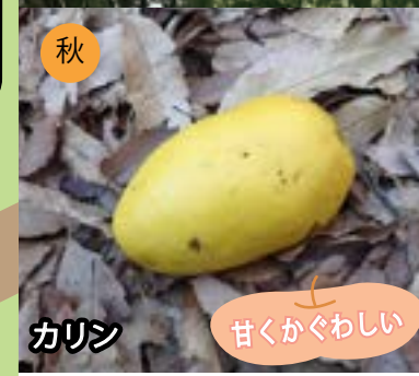
秋 カリン 甘くかぐわしい