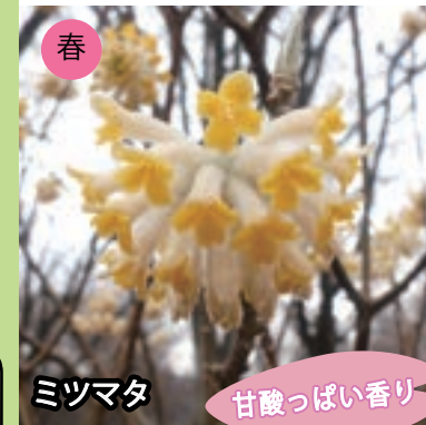
春 ミツマタ 甘酸っぱい香り