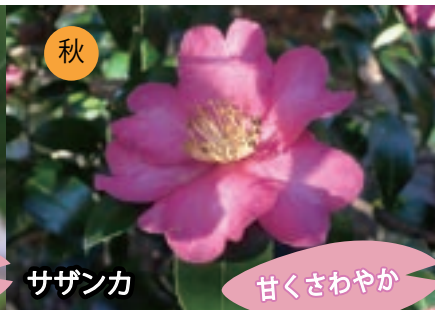
秋 サザンカ 甘くさわやか