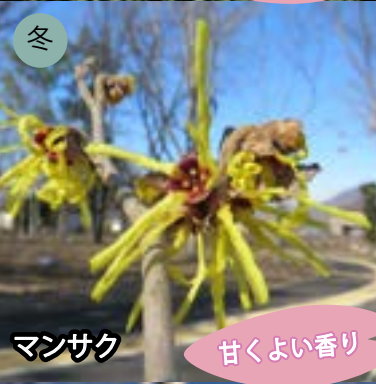
冬 マンサク 甘くよい香り