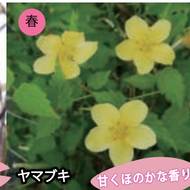
春 ヤマブキ 甘くほのかな香り