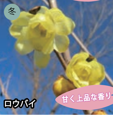
冬 ロウバイ 甘く上品な香り