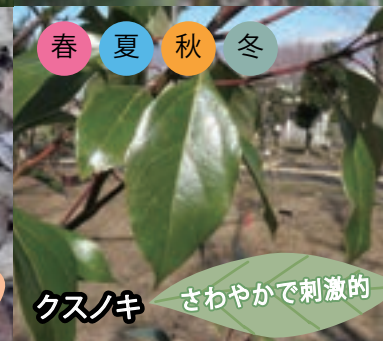
秋 クスノキ さわやかで刺激的