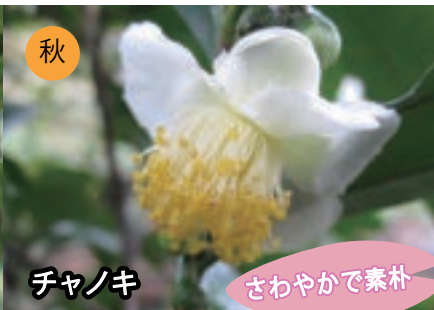
秋 チャノキ さわやかで素朴