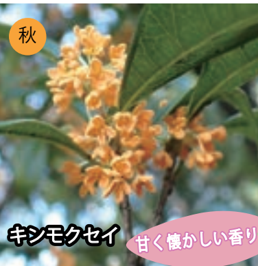
秋 キンモクセイ 甘く懐かしい香り