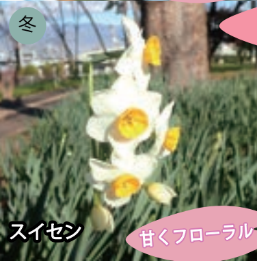
冬 スイセン 甘くフローラル