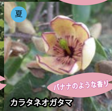
夏 カラタネオガタマ パナナのような香り